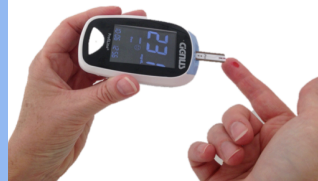
Messung & Wiedergabe der Messwerte durch Piepen