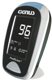
ProfiLine BLE TeleMed